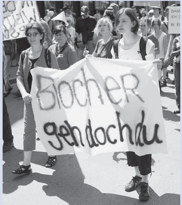
Die Bilder dieser Ausgabe stammen von der erfolgreichen Grossdemonstration «wir sind die schweiz.» vom 18. Juni 2005

Selbstverständlich kann das Recht einzuwandern mit guten Gründen rechtlich reglementiert werden, nur darf der Grund der Einschränkung nicht einseitig die Sicherung des Reichtums im Einwanderungsland sein. Gerade dies ist aber bei den Gegnern einer erweiterten Migrationspolitik der Fall. Sie operieren vordergründig mit kulturellen Argumenten und führen an, dass die Zuwanderung von Menschen aus dem Ausland zu einer Gefährdung der eingelebten Lebensformen führt und dass die multikulturelle Gesellschaft letztlich die Errungenschaften unseres Landes zerstöre. Schaut man genauer hin, wird klar, dass sich hinter diesen Argumenten Ängste vor einem Wohlstandsverlust und Versuche, die privilegierten Lebenszusammenhänge zu erhalten, verstecken. Neben der Haltlosigkeit dieser Ängste ist diese Haltung im Hinblick auf eine globale Menschenrechtspolitik verwerflich, denn es geht in unserer mehr und