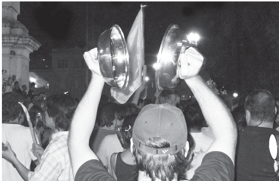
Cacerolazo in Argentinien.