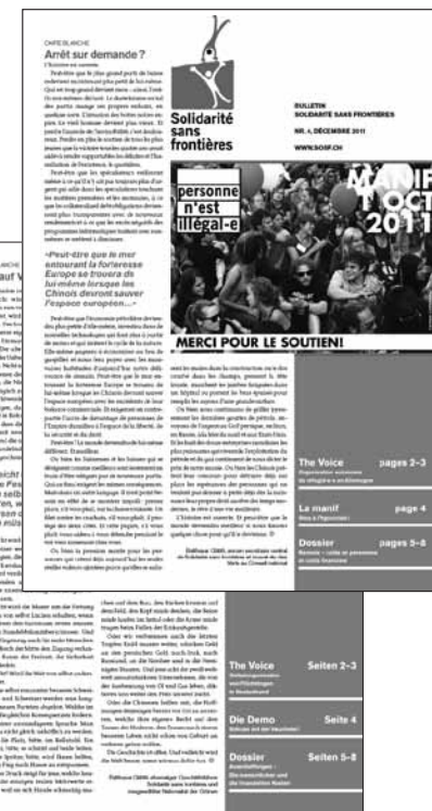
Das Bulletin von Solidarité sans frontières erscheint viermal im Jahr.

Solidarité sans frontières forderte erneut den Verzicht auf Zwangsausschaffungen. Zwangsausschaffungen sind unmenschlich, finanzieller Irrsinn und grundsätzlich nicht vertretbar. Bei einer sogenannten Level 2-Ausschaffung in Zürich wurde im Juli 2011 ein Nigerianer brutal verprügelt. Das BFM ist anscheinend nicht im Stande, das regelmässige Auftreten solcher unhaltbaren Zwischenfälle zu vermeiden. Die Forderung nach einer Abschaffung der Zwangsausschaffungen bleibt deshalb aktuell.