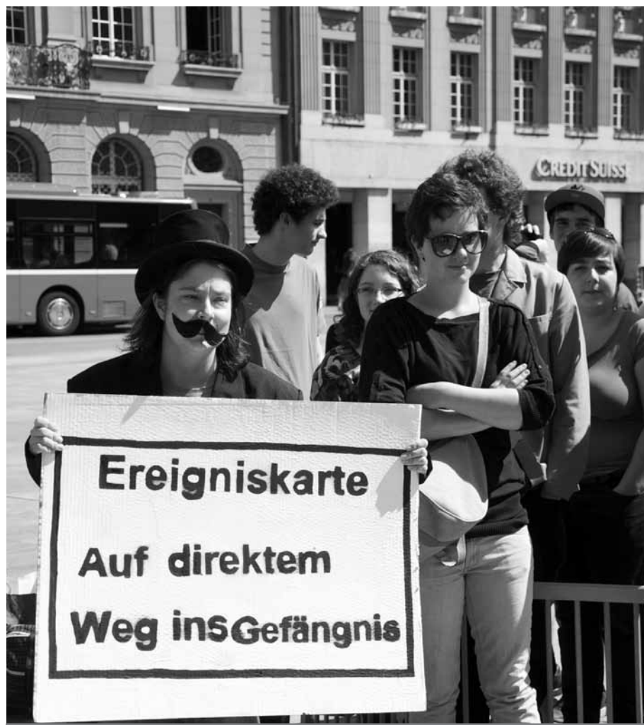
Aktion gegen Nothilfe in Bern

Les dossiers des bulletins ont été consacrés aux thèmes suivants: « 2xNon – rétrospective sur la campagne référendaire », « Quelle crise? L'Afrique du Nord, l'Europe et la Suisse », « Révision sans fin de la loi sur l'asile », « Renvois – coûts en personnes et coûts financiers ».