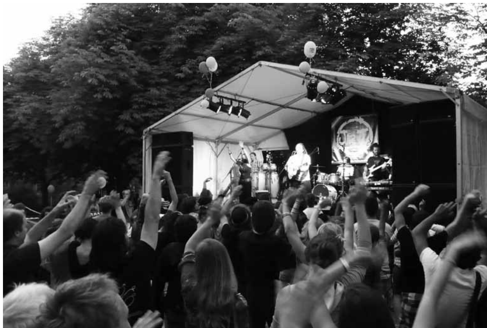
Papierlos-Festival im Lorrainepärkli Bern

Ausschaffungshäftlinge baten dringend, ihnen Schlafsäcke mitzubringen, da sie ja in den italienischen Städten obdachlos überleben mussten.