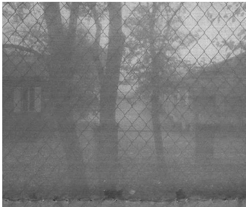
Das Juch-Areal in Zürich

Ich habe die Stelle vor drei Wochen in der Kolumne so ausgeschrieben. Interessenten sollten ihrer Bewerbung einen Schweizernachweis für alle vier Grosseeltern beilegen. Für den Fall, dass zu viele Bewerber