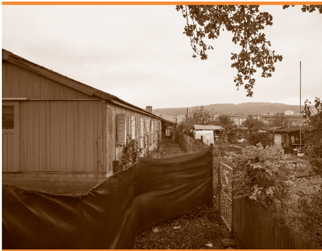
Das Juch-Areal in Zürich Altstetten, Testzentrum

Bevölkerung geht, das nicht den roten Pass besitzt. Die zweite Kammer, der Ständerat, wird in der Sommersession erstmals darüber befinden müssen. Seine staatspolitische Kommission (SPK-S) tagte am 20. Mai, sieben Tage nach Redaktionsschluss dieses Bulletins. Die kleine Kammer hat also die Möglichkeit, nein sogar die Pflicht, das vom Nationalrat begonnene Schlachtfest zu stoppen.