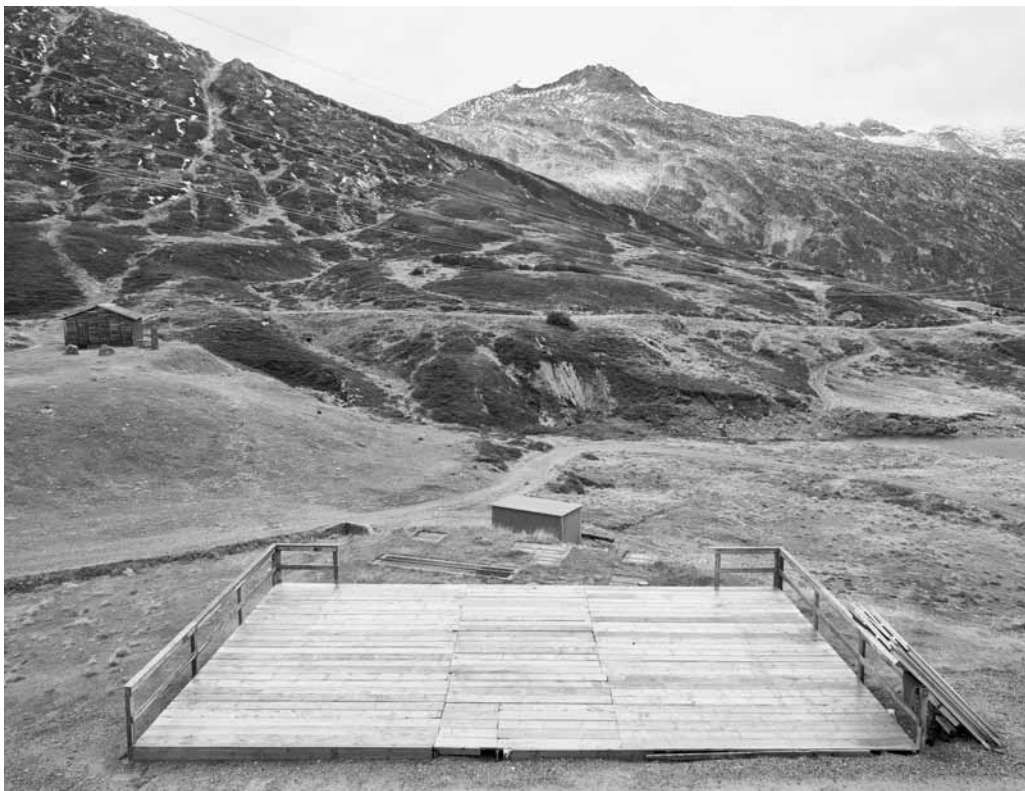
Bundeszentrum auf dem Lukmanier zum Zweiten.

Road to Nowhere – Asyl & Politik, Hinterland Nr. 25/iz3w Ausgabe 341, März/April 2014, 88 Seiten, als pdf unter