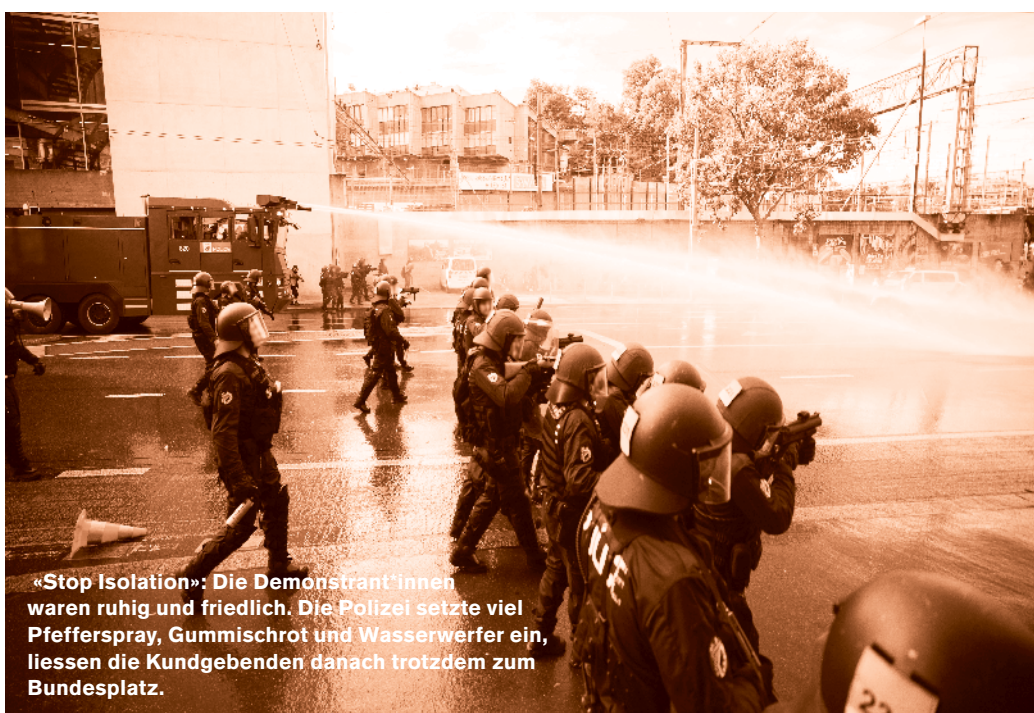
«Stop Isolation»: Die Demonstrant*innen waren ruhig und friedlich. Die Polizei setzte viel Pfefferspray, Gummischrot und Wasserwerfer ein, liessen die Kundgebenden danach trotzdem zum Bundesplatz.

«Es ist das erste Mal seit dem Schengen-Beitritt der Schweiz, dass eine Kammer des Parlaments die Erweiterung des Schengen-Acquis ablehnt.»