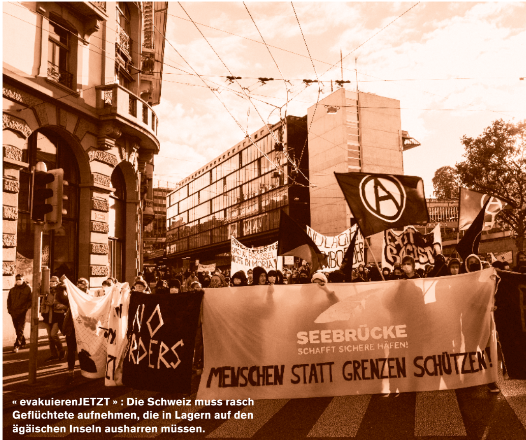
« evakuierenJETZT » : Die Schweiz muss rasch Geflüchtete aufnehmen, die in Lagern auf den ägäischen Inseln ausharren müssen.

1963 waren sie hochwillkommen in der Schweiz, die Tibeter*innen auf der Flucht vor dem kommunistischen Regime. Als ich 1995 nach China an die 4. UNO-Weltfrauenkonferenz reiste, trugen wir aus Protest Broschen mit der Tibetflagge und bekamen gehörig Ärger. 1999 hingen