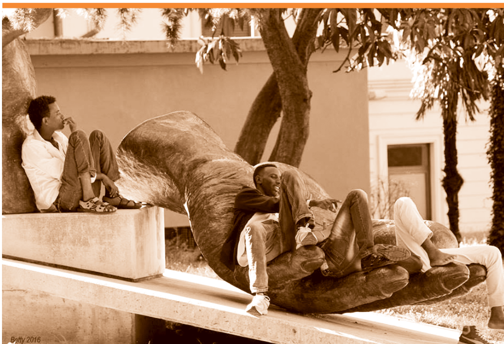
Im Park nahe des Bahnhofs von Como, Sommer 2016

Schweiz durchwandern, kleine Dörfer ebenso wie grosse Städte. 1000 Kilometer unterteilt in 52 Etappen von rund 20 Kilometern. Natürlich kann man sich dem Marsch auch nur für einen Tag anschliessen oder für ein paar Stunden. Wenn man nicht selber mitmachen kann, so kann man dennoch die Beweggründe unterstützen, durch eine Spende oder durch Verbreitung der Botschaft. Andere Märsche vor diesem haben gezeigt, dass es manchmal nötig ist, selber aktiv zu sein und Risiken einzugehen, um etwas zu bewirken, und dass zivile Bewegungen die Gesellschaft verändern können. Heute werden die MigrantInnen in der Schweiz als Problem angesehen, wir dagegen empfinden sie als Bereicherung. Dublin-Rückschaffungen und Administrativhaft verletzen die Würde der Menschen; eine bessere Aufnahme ist nicht nur möglich, sondern Pflicht. Wir erwarten euch mit guten Schuhen und mit Lust auf eine wunderbare Erfahrung von ziviler Solidarität.