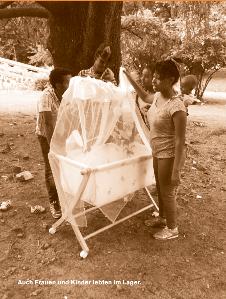
Auch Frauen und Kinder lebten im Lager.

BEWEGUNGSFREIHEIT NUR BIS ZUR GEMEINDEGRENZE