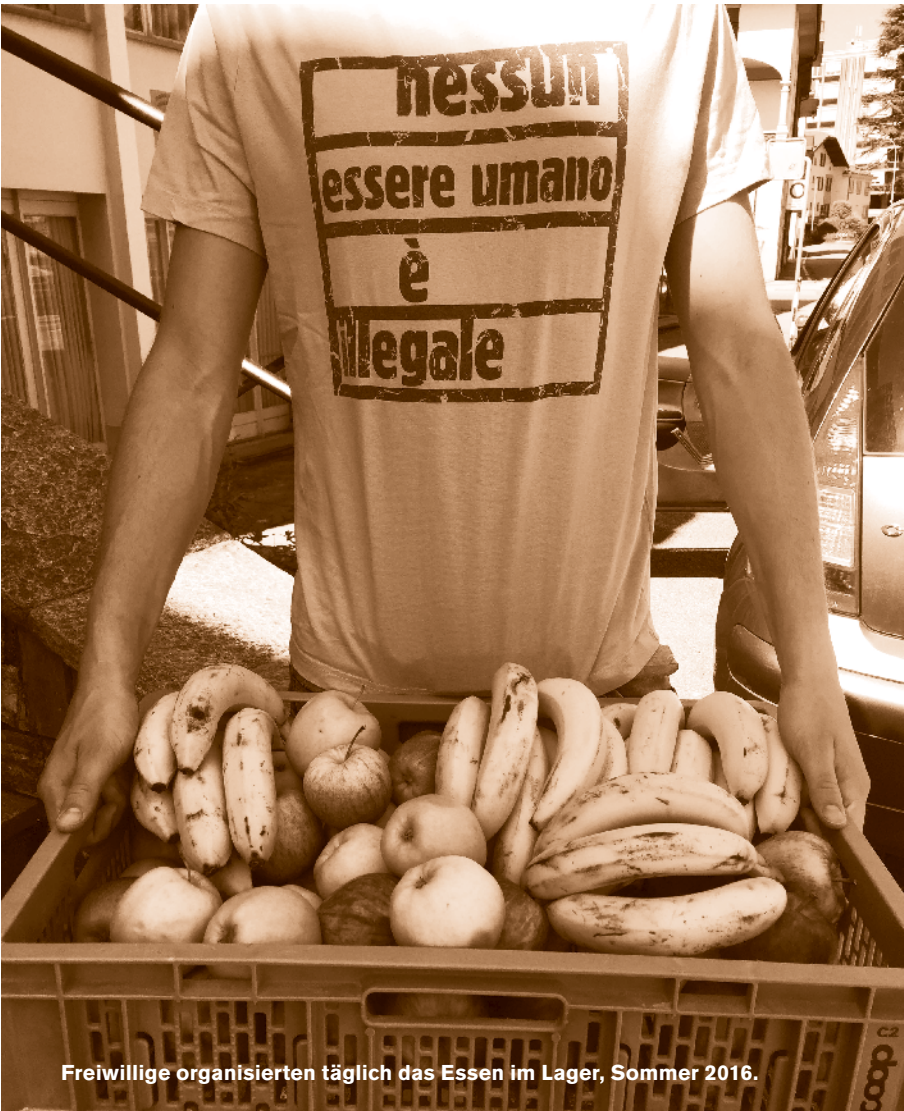
Freiwillige organisierten täglich das Essen im Lager, Sommer 2016.

habe das Personal Wichtigeres zu tun. «Es ist und bleibt richtig, dass nach unserem Gesetz bestehende Ausreisepflichten durchgesetzt werden müssen.»