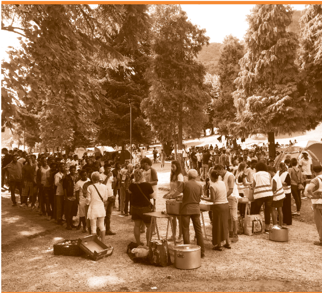
Hunderte MigrantInnen standen täglich Schlange für eine warme Mahlzeit.

was ihr Leben im Alltag deutlich erschwert. Wie viel Gewalt hinter den Zwangsmassnahmen steckt, zeigt auch der Bericht einer Aktivistin des Collectif R über einen Asylsuchenden, dem die Waadtländer Behörden eine Notschlafstelle in Morges als Wohnort zuwiesen – mit dem Verbot, diesen Ort in den Nachtstunden zu verlassen.