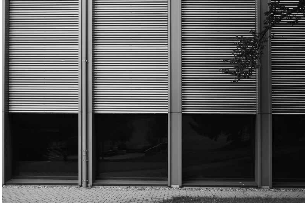
Giffers (FR). La Gouglera, eine ehemalige Klinik für Menschen, die unter Übergewicht oder Fettleibigkeit leiden, wird demnächst zum «Ausreisezentrum» umfunktioniert.

Für die Masse der Zürcher MigrantInnen macht es im Alltag einen grossen Unterschied, Informationen aus ihrem Herkunftsland zu erhalten oder in ihrer eigenen Sprache Nachrichten über die Schweiz empfangen zu