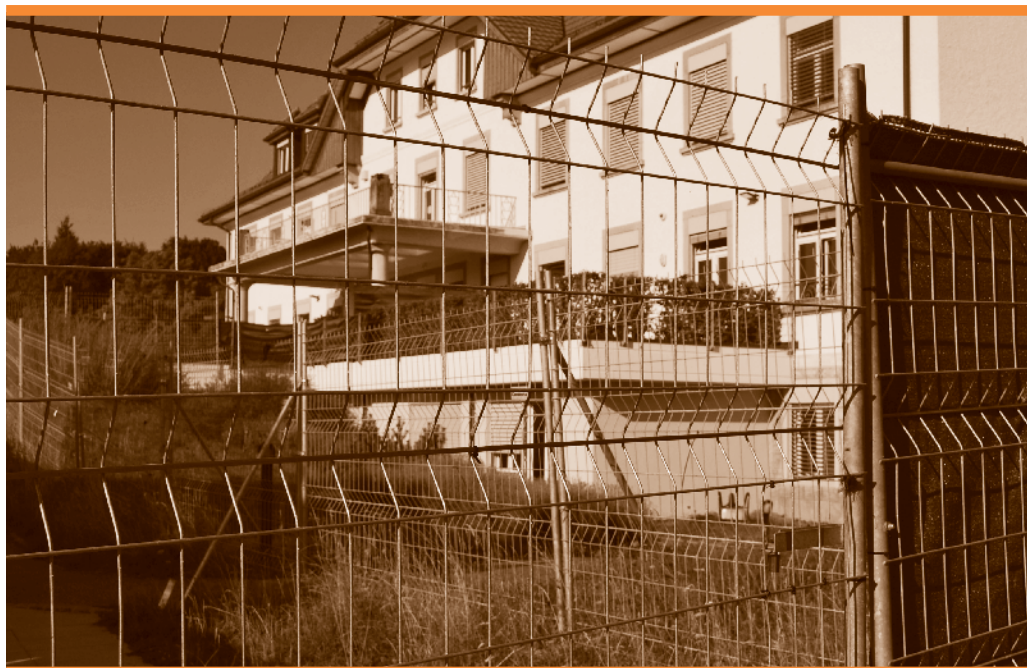
Perreux (NE): Die ehemalige psychiatrische Klinik wird bereits heute als Aussenstelle des Empfangszentrums Vallorbe genutzt und wird künftig zum Verfahrenszentrum.

ein Raum ohne Binnengrenzen? Niemand glaubt mehr daran.